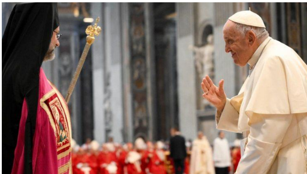
Đức Thánh Cha chào Phái đoàn Tòa Thượng phụ Đại kết